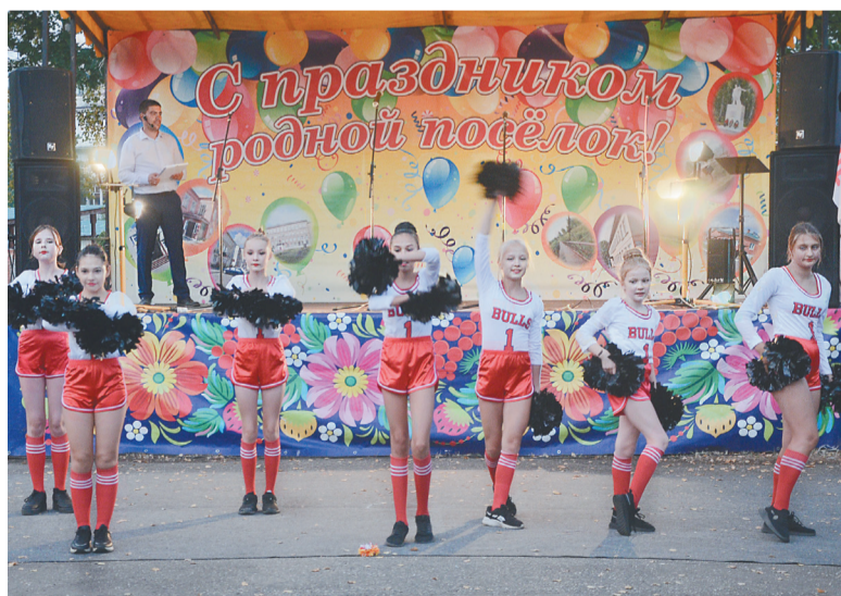
☞ Ансамбль «Черлидинг»

Закончился праздник зажигательной дискотекой, на которой все участники дали волю чувствам и эмоциям, а танцевали так, что плавился асфальт. Ну а в финале прогремел праздничный салют.