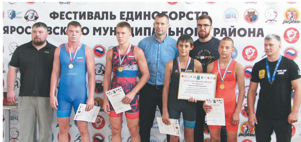
Награждение борцов греко-римского стиля