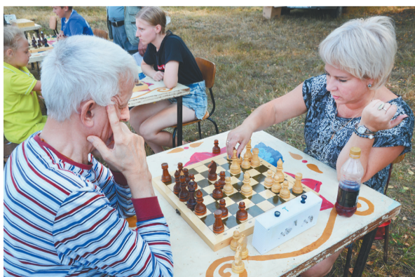
☞ Спортивные баталии